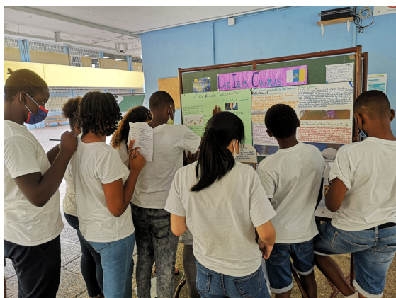
Quizz sur les Îles Canaries