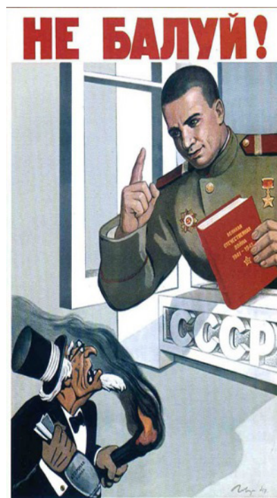
« Ne fais pas de bêtises! », Govorkov, 1947.

La démarche d'analyse prend appui sur l'étude comparée des personnages représentés. Il s'agit de décrire méthodiquement et décomposer les deux vignettes en mettant en lumière les personnages (caractéristiques physiques, gestes, attitudes), les messages textuels ainsi que les choix des auteurs pour en saisir les intentions, notamment dans la façon de représenter l'autre.