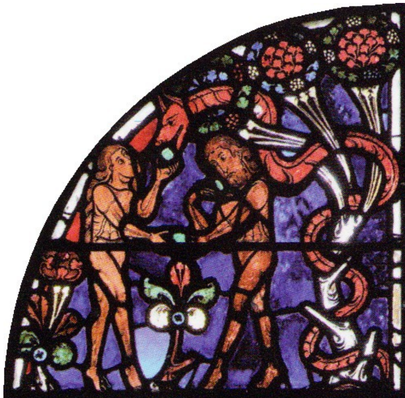
La parabole du bon samaritain, détail du vitrail de la cathédrale Saint-Étienne de Bourges, XIIIe siècle