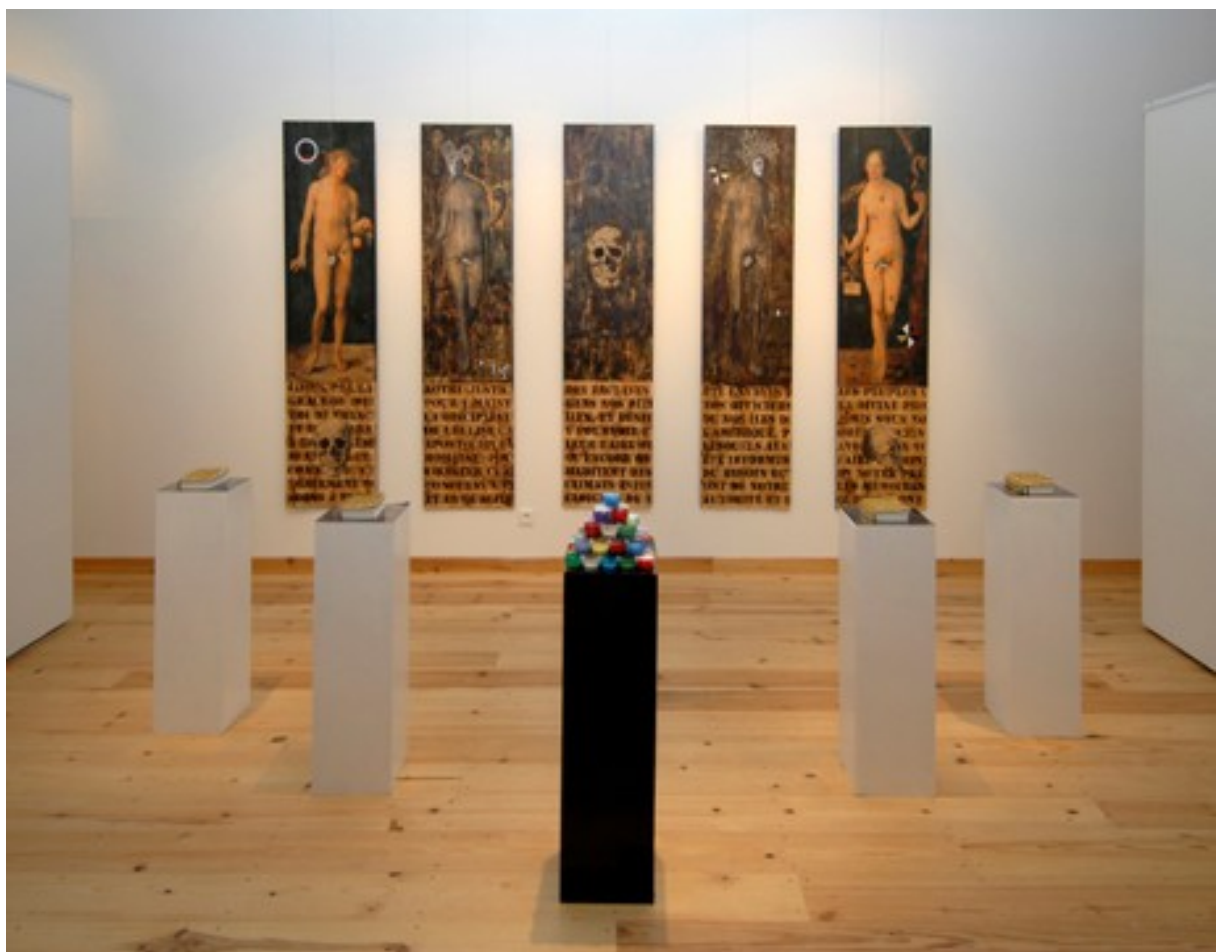
Bruno PEDURAND : L'Héritage de Cham, 2008

Installation : décalcomanie, huile, clous sur bois - dimensions variables, chaque panneau 200 x 50 cm