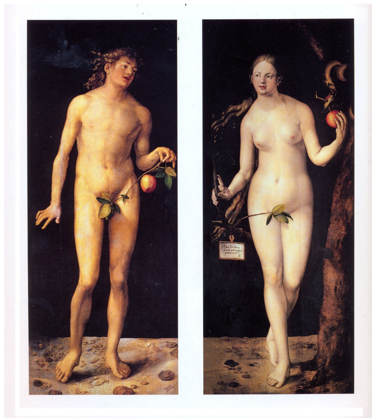
Albrecht Dürer, Adam et Ève, 1507