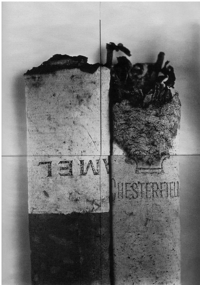
Irving Penn, Cigarette n° 37, New-York, 1972