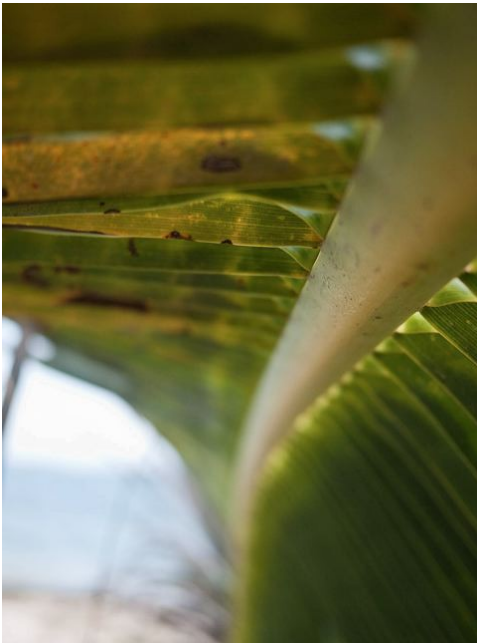
David GUMBS :

Artiste-plasticien guadeloupéen né en 1977, originaire de Saint-Martin. Vit et travaille entre Paris et la Martinique. Exploite dans ses créations aussi bien la photographie, la vidéo, la peinture, l'art numérique ou la peinture digitale. A récemment conçu des œuvres interactives (se modifiant grâce à l'intervention du spectateur).