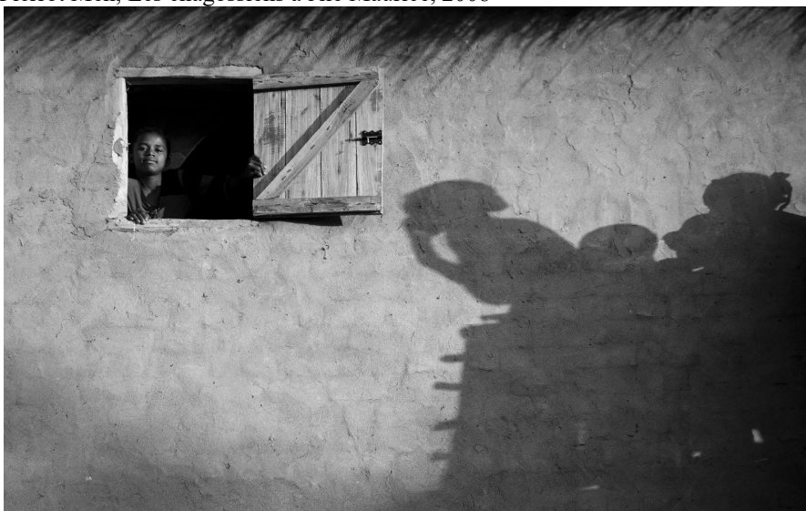
Pierrot Men, série villages, Sahambavy, 2012