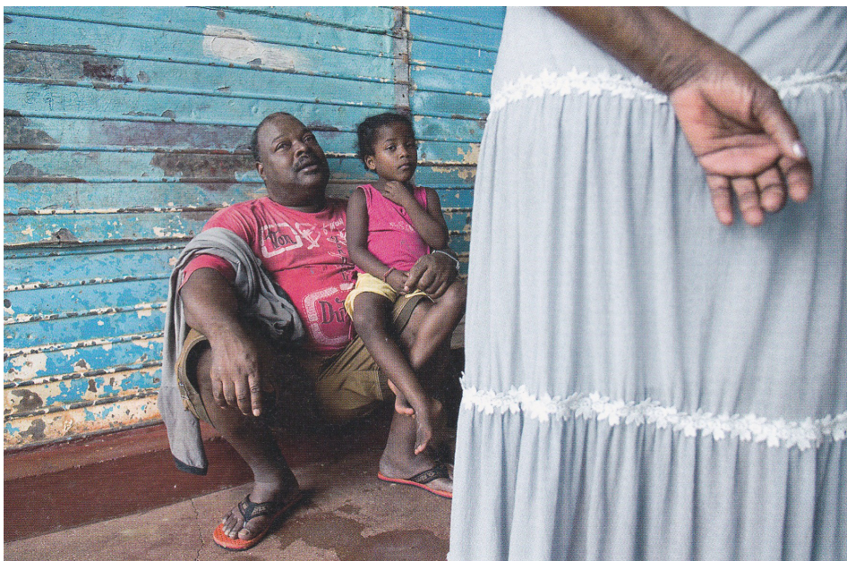
Pierrot Men, Les chagossiens à l'île Maurice, 2008