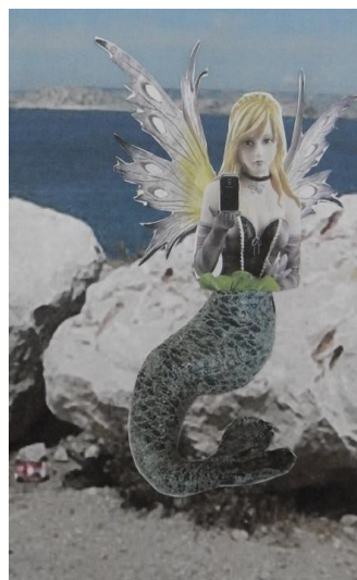
Détail du personnage