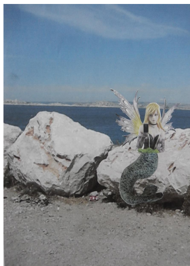
Vue générale de l'exercice rendu au format A4

Projet réalisé en avril-mai 2014 au collège du Gosier.