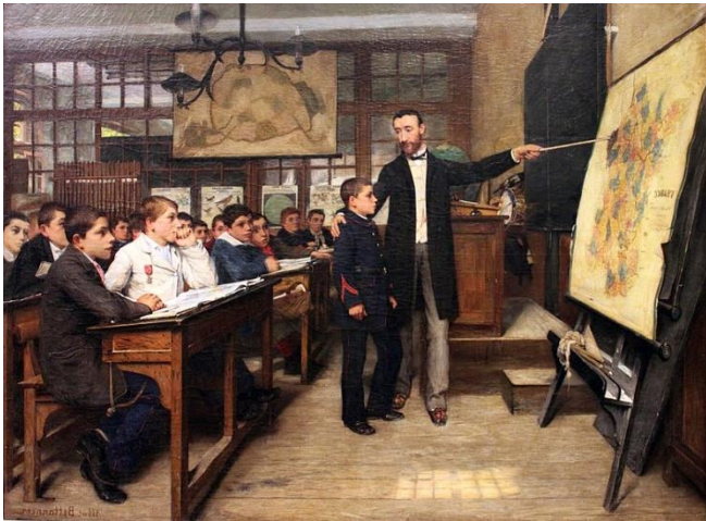
La tache noire, Albert Bettannier , 1887

Au fond de la classe : un râtelier avec fusils Bataillons d'enfants dans les années 1880