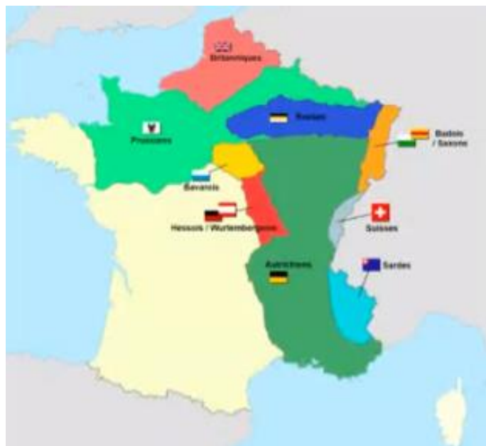
Carte de la France sous occupation des Alliés de 1815 à 1818.

A provoqué famine, émeute, migrations. Première vague de migration européenne vers l'Amérique.