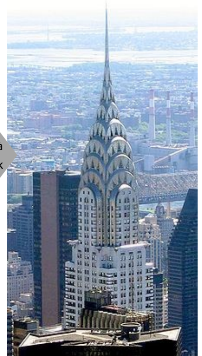
Chrysler Building à New-York