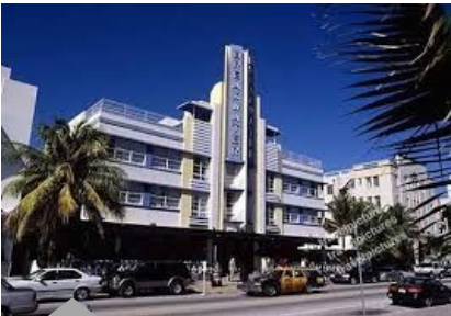
Immeuble à Miami