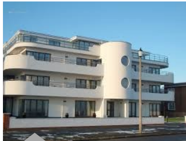
Immeuble à Miami