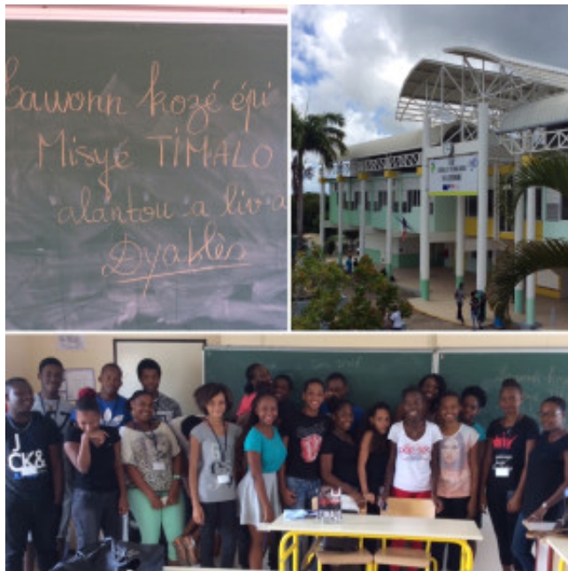
Les élèves du Lycée de Sainte-Anne