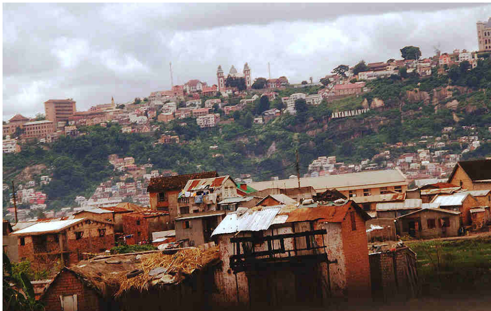
Vue d'Antananarivo, février 2012, Site de Soahary, blogueuse malgache, page consultée le 13/10/16