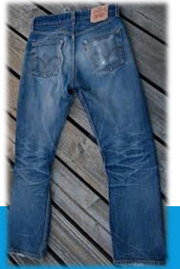
Levi's 501 raw jeans