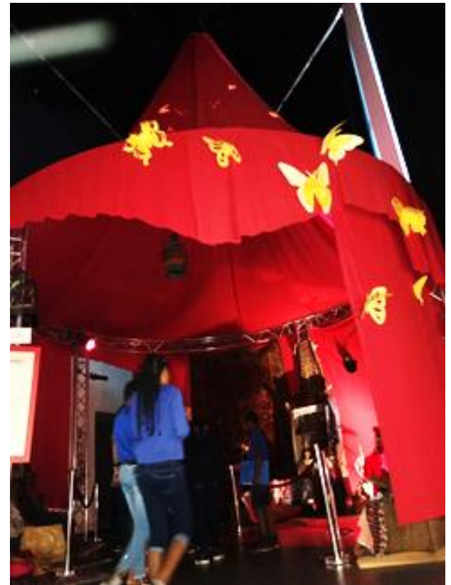
Entrée de la Tente de Melquiades