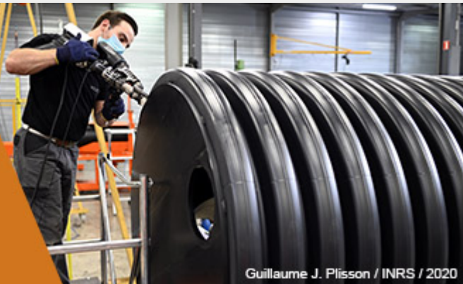
Guillaume J. Plisson / INRS / 2020

C'est un secteur qui se réinvente. Portée par la construction, l'alimentaire, l'automobile et les produits électriques et électroniques, la plasturgie doit faire face aux préoccupations écologiques et à un durcissement réglementaire qui ont contribué au développement du recyclage et de l'éco-conception. Aujourd'hui, nombre d'industriels gèrent en parallèle ressource vierge et ressource recyclée. De nouvelles technologies, telles que la fabrication additive, s'invitent dans le jeu. La production et les organisations du travail évoluent. Explications.