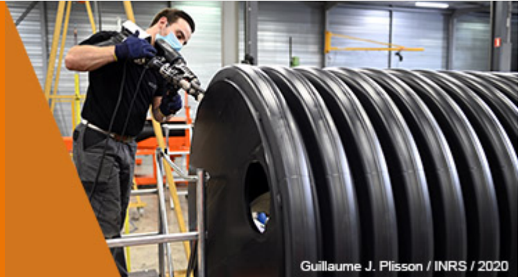
Guillaume J. Plisson / INRS / 2020

C'est un secteur qui se réinvente. Portée par la construction, l'alimentaire, l'automobile et les produits électriques et électroniques, la plasturgie doit faire face aux préoccupations écologiques et à un durcissement réglementaire qui ont contribué au développement du recyclage et de l'éco-conception. Aujourd'hui, nombre d'industriels gèrent en parallèle ressource vierge et ressource recyclée. De nouvelles technologies, telles que la fabrication additive, s'invitent dans le jeu. La production et les organisations du travail évoluent. Explications.