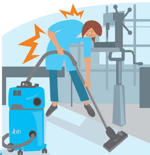
DOULEURS AU DOS ET AUX ARTICULATIONS