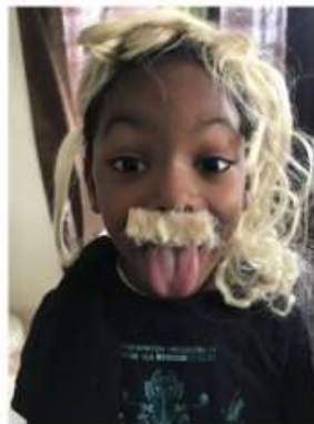
Mawon (moyenne section)