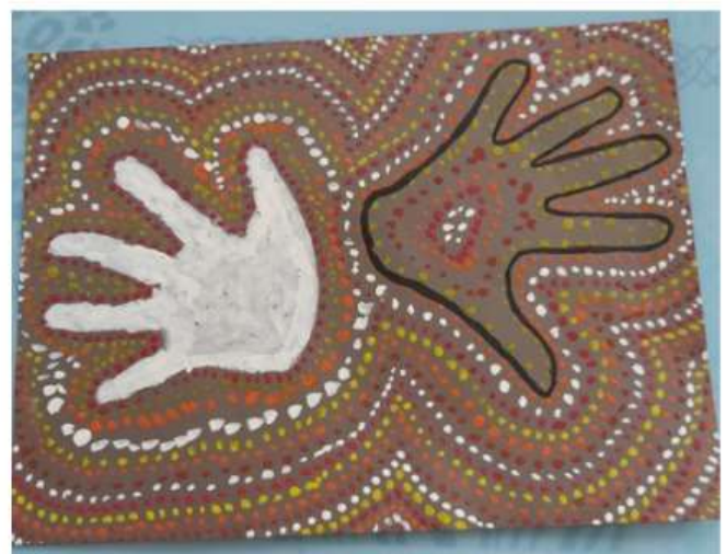
Travail autour de la culture aborigène. Réalisation : Alisha (grande section)