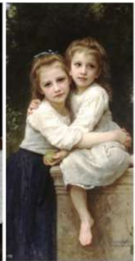
Maëraëlaënimo (petite section) et Maërimo (grande section)

En parallèle, des activités pédagogiques propres à chaque domaine se poursuivent ainsi que les projets commencés dans l'année ; à l'instar du tour du monde avec les grandes sections, qui s'est traduit pendant le confinement par la découverte de la culture aborigène.