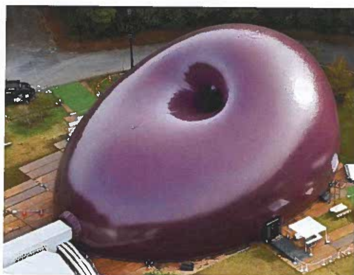
5 - Arata ISOZAKI / Anish KAPOOR, Ark Nova , PVC, Japon – 2013.