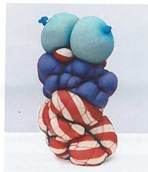
3 - TAWAKOL Hoda, Mummy N°20 , Nylon, riz, résine, 2022.