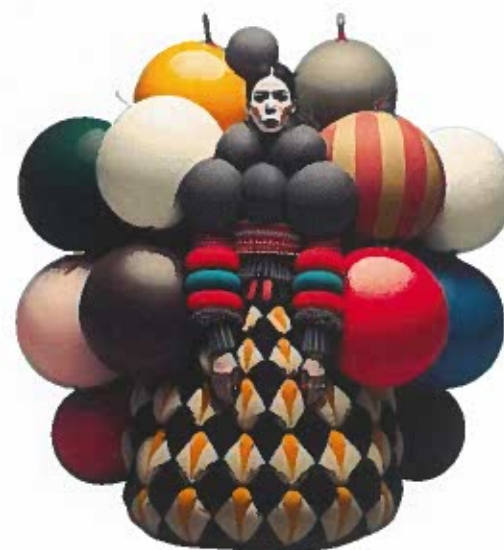
6 - MAISONMETA, Bubble me up editorial 15 , Intelligence artificielle, 2022.