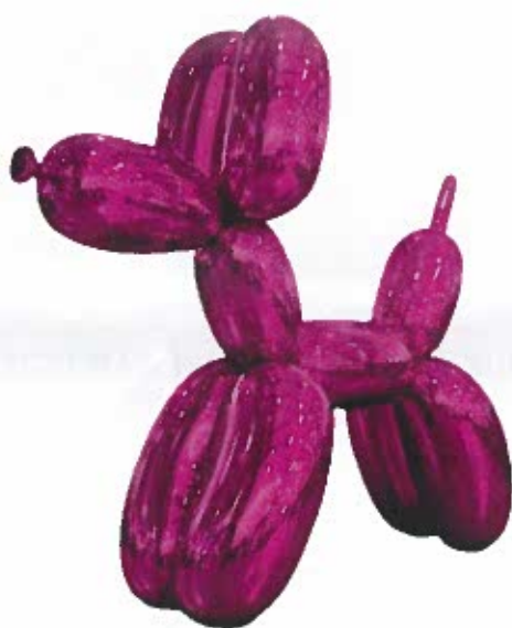
2 - KOONS Jeff, Balloon Dog magenta , Acier inoxydable, 1994 / 2000.