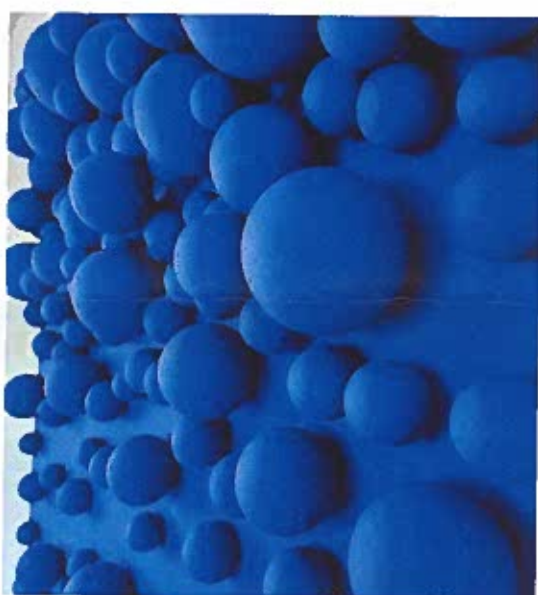
1 - JACQUET Jean-Paul, Bubble , Acrylique, polystyrène, toile, coton, 2023.