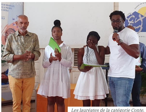
Les lauréates de la catégorie Conte.