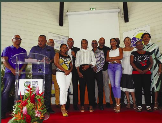
L'équipe de cette 4 e édition « Majo an maké kréyol »