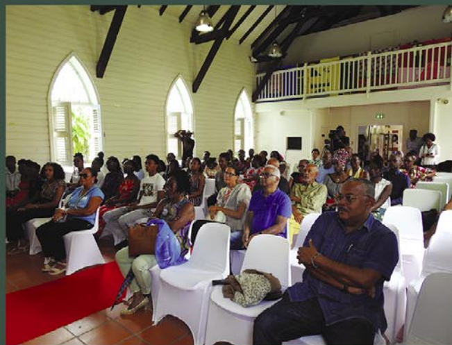
Le public de passionnés de la langue créole était au rendez-vous