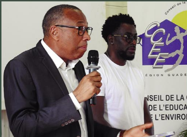
Le président du CCE et Riddla parrain de la manifestation