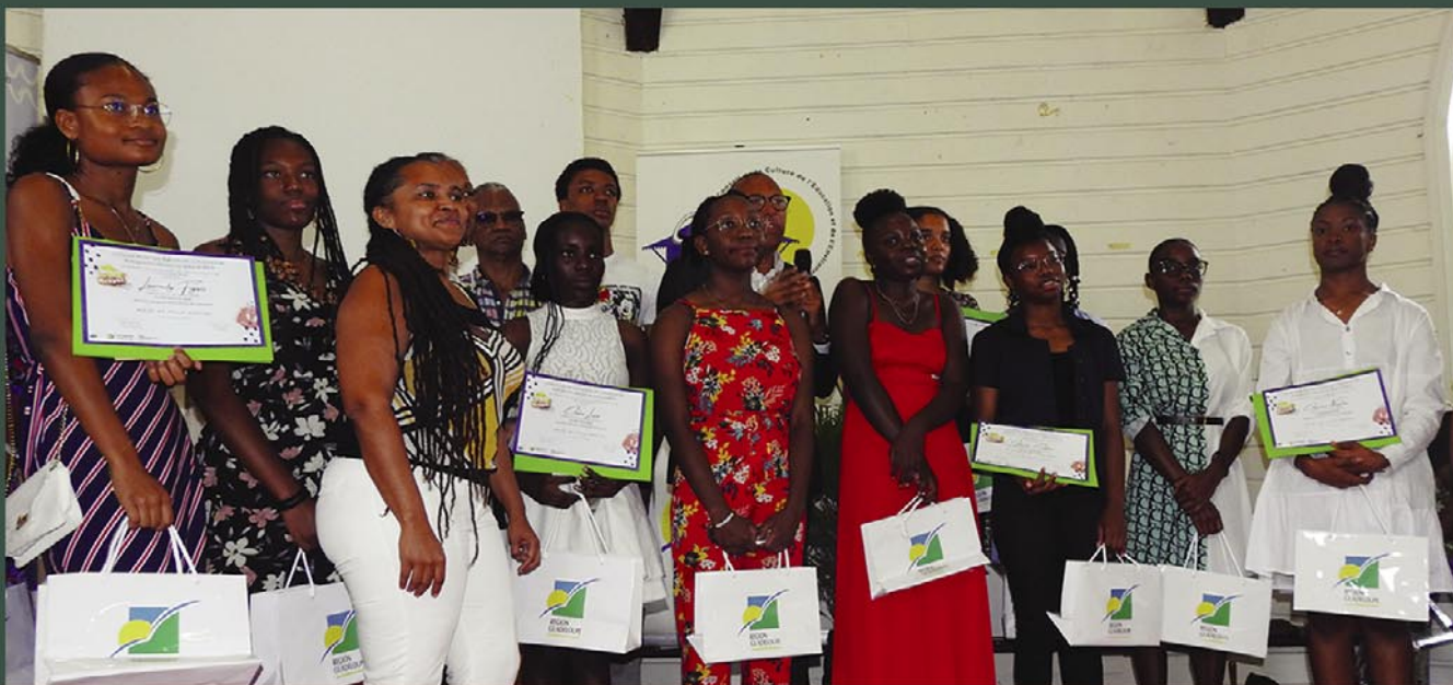
Les lauréates de la 4 e édition du Maké Kréyol