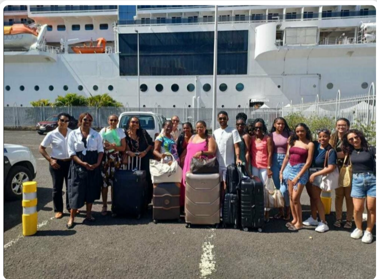
Article France Antilles Guadeloupe

Les étudiants ont eu l'occasion de s'exprimer dans les trois langues dans le cadre des excursions qu'ils ont organisées et animées.