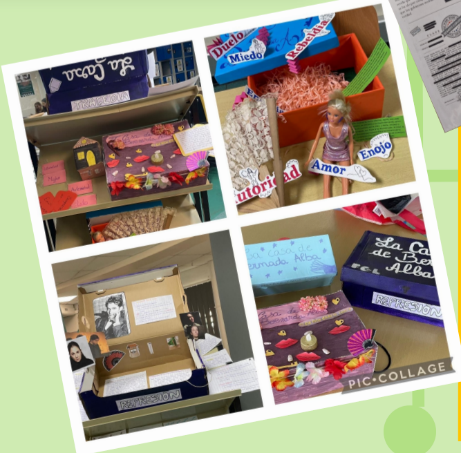
Ficha proyecto final

Activité : Création d'une boîte de lecture permettant d'explorer et d'analyser l'œuvre sous une forme originale et créative.