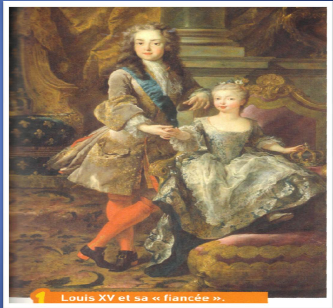
1 Louis XV et sa « fiancée ».

Tableau du XVIII ème représentant Louis XV et Marie-Anne-Victoire de Bourbon