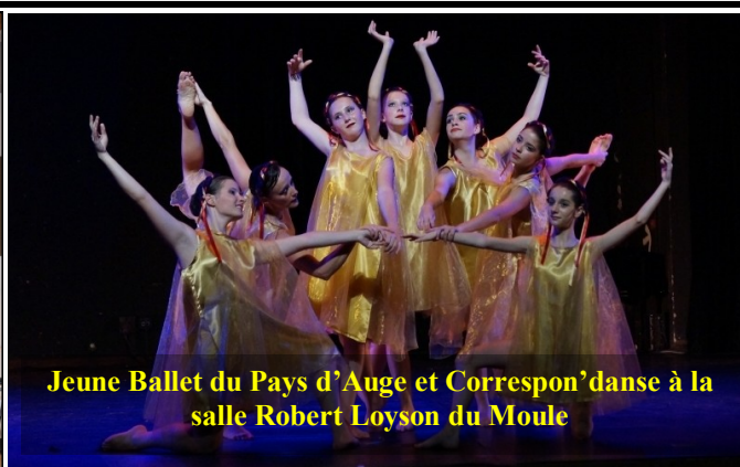
Jeune Ballet du Pays d'Auge et Correspon'danse à la salle Robert Loyson du Moule