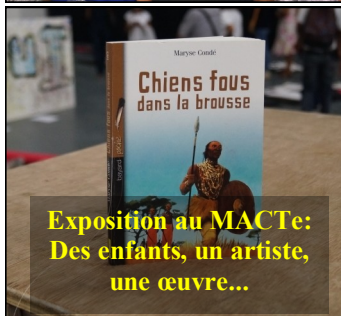
Exposition au MACTE: Des enfants, un artiste, une œuvre...