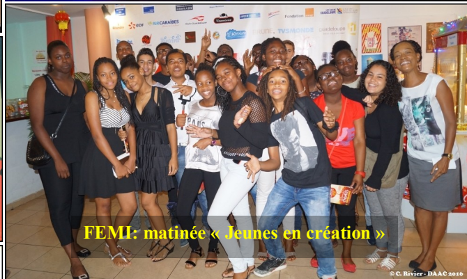
FEMI: matinée « Jeunes en création »