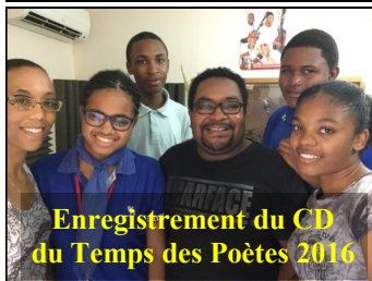
Enregistrement du CD du Temps des Poètes 2016