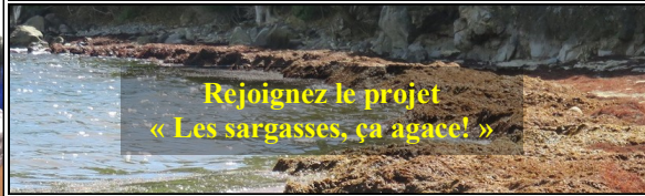
Rejoignez le projet « Les sargasses, ça agace! »