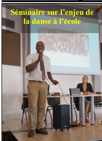
Séminaire sur l'enjeu de la danse à l'école