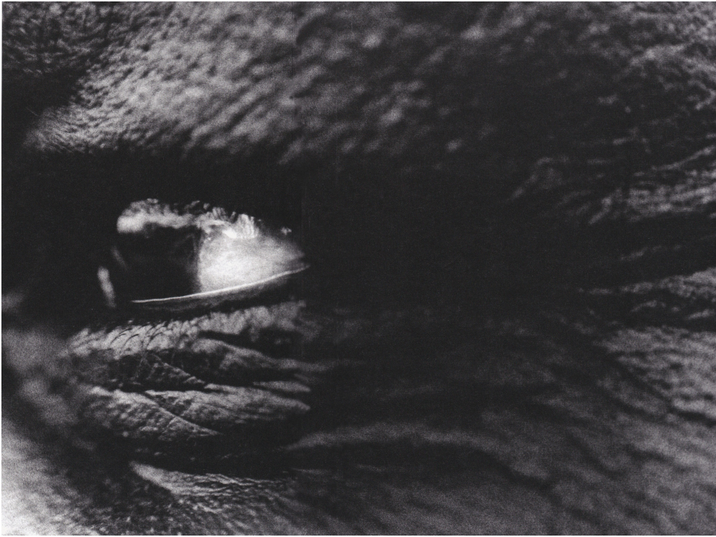
Jean-François Manicom, La mort du loup, 2001