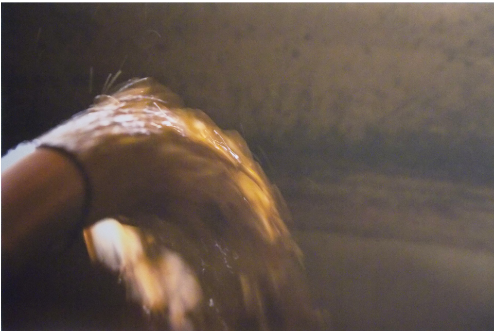
Daniel Dabriou, Dlo Doubout, 2014

Reconnait-on facilement tous ces objets ? - Sur quoi / quels éléments ces photographes ont-ils joué pour rendre leur sujet difficilement identifiable ? (Ont-ils fait la même chose que vous?) - La photographie restitue-t-elle vraiment la réalité ?