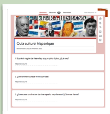
Quiz culturel hispanique