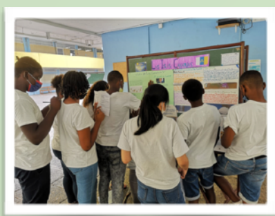
Quiz sur les Iles Canaries