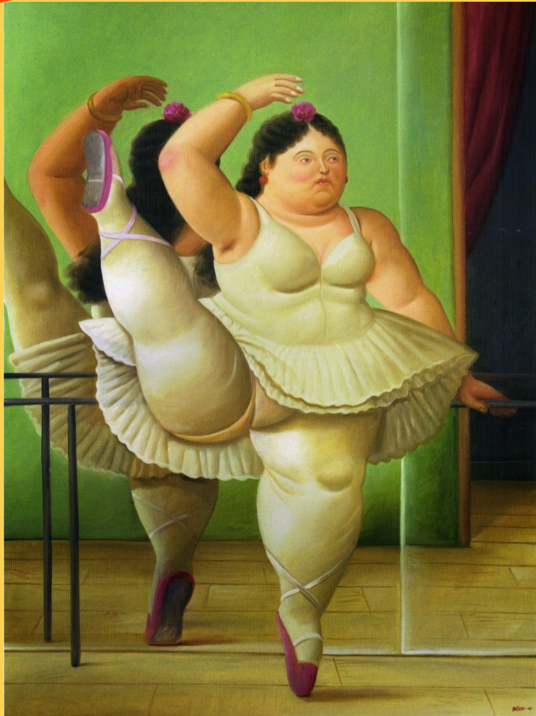
La bailarina en la barra de Fernando Botero (2001)