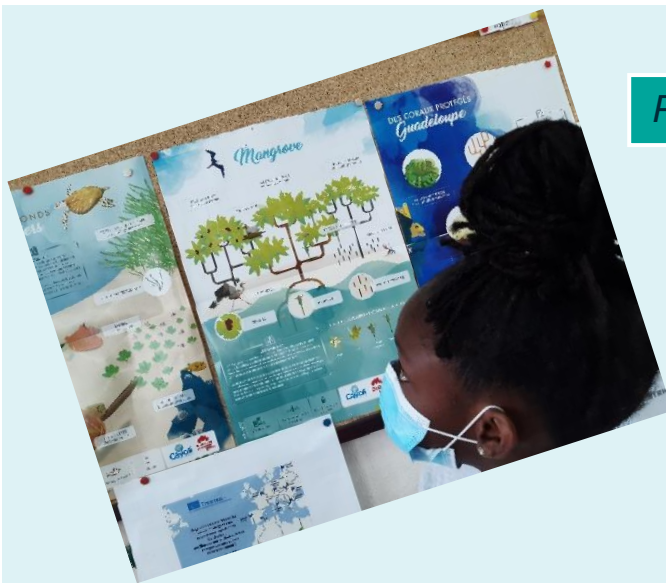
Présentation de la mangrove