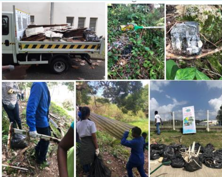
Nettoyage de la mangrove (février 2020)