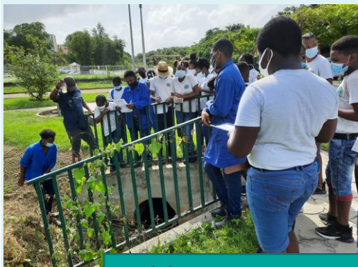
Prélèvement et analyse de l'eau