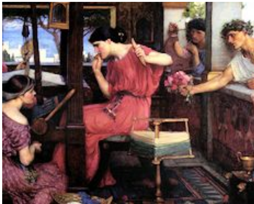
Pénélope et les prétendants, J.W Waterhouse, 1912

Pendant l'absence d'Ulysse, Pénélope gagne du temps avec les prétendants en employant une ruse : elle affirme qu'elle reprendra un époux lorsqu'elle aura terminé de tisser un suaire pour Laërte, le père d'Ulysse ; en réalité, elle défait chaque nuit son travail de la journée, de sorte que l'ouvrage n'avance pas