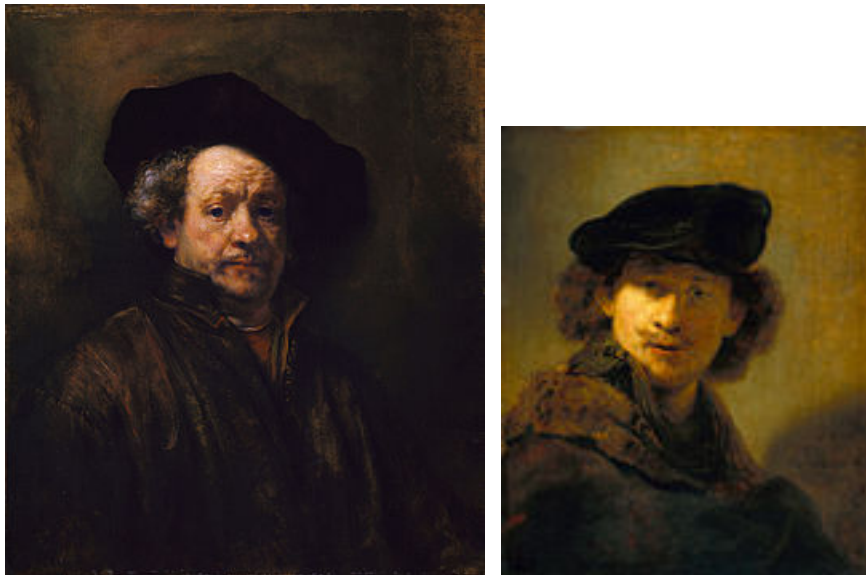
Autoportraits de Rembrandt

5) De quelles façons le narrateur insiste-t-il sur la dimension surnaturelle du personnage de Chabert ?