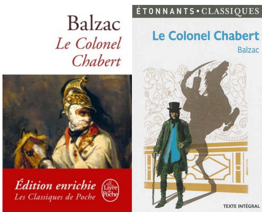
Exemples de premières de couverture, Le Colonel Chabert , Balzac

Objectif : comment Balzac s'inspire-t-il du monde réel ? Comment le romancier crée-t-il un véritable "monde" dans son roman ?