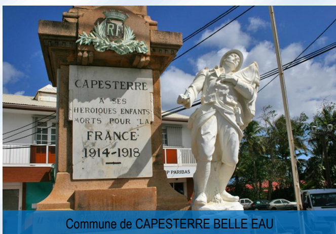
Commune de CAPESTERRE BELLE EAU

"Un homme n'est jamais tout à fait mort tant qu'il y a quelqu'un pour prononcer son nom" Antoine de Saint Exupéry