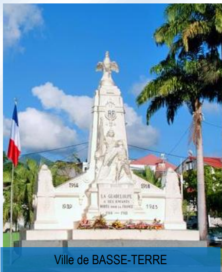
Ville de BASSE-TERRE