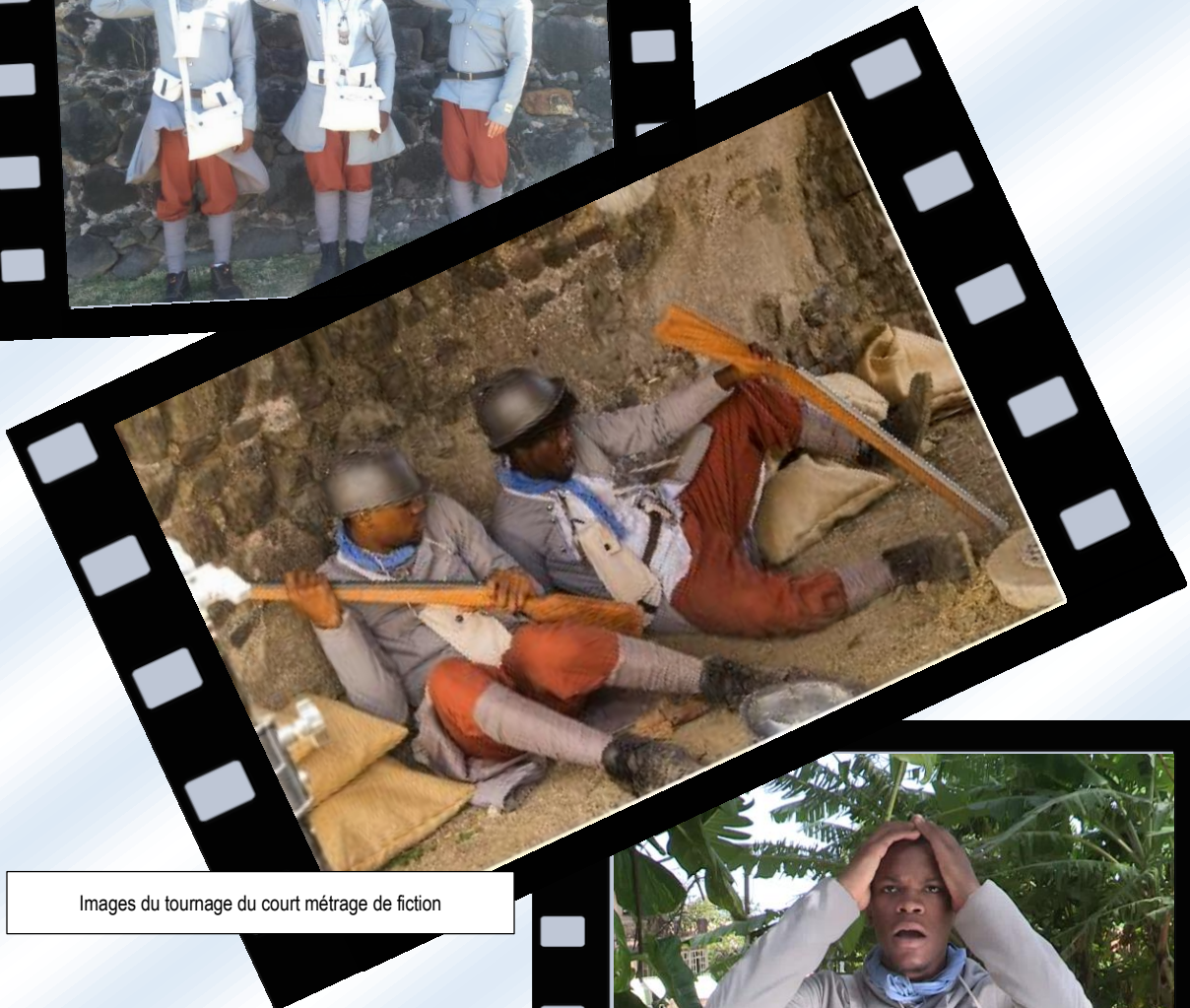
Images du tournage du court métrage de fiction