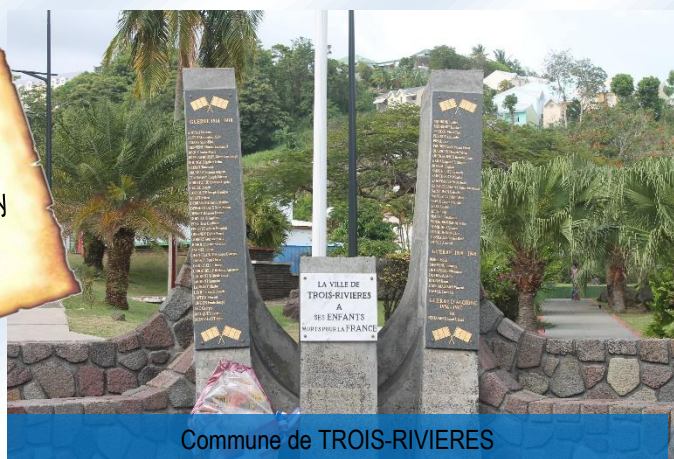
Commune de TROIS-RIVIERES

"Un homme n'est jamais tout à fait mort tant qu'il y a quelqu'un pour prononcer son nom" Antoine de Saint Exupéry