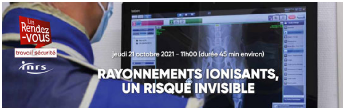
Table ronde en ligne : Rendez-vous le jeudi 21 octobre 2021 à 11 h

La rédaction de la revue Travail & Sécurité vous convie à une nouvelle table ronde en ligne sur le thème « Rayonnements ionisants : un risque invisible ». Qu'est-ce que la radioactivité ? Quels sont les risques pour la santé ? Dans quels secteurs d'activité peut-on être exposé aux rayonnements ionisants ? Quelle prévention mettre en place et de quelles ressources les entreprises peuvent-elles disposer ? Des experts répondront aux principales questions posées et des entreprises viendront apporter leur témoignage.